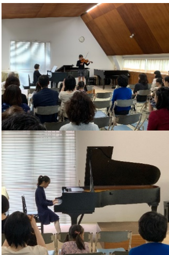
ホールに出演者たちそれぞれの音色が響き渡ります。