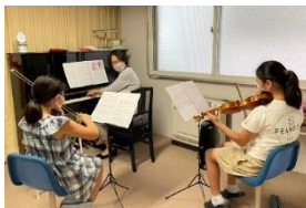
各グループお部屋に分かれてアンサンブルを練習。