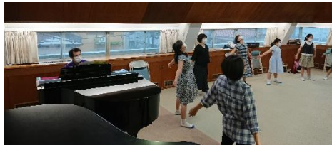
↑津布楽先生のピアノ生演奏で、豪華なラジオ体操です!朝一番にみんなで身体を動かして、さあレッスン開始!