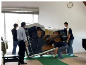
傷つけないようしっかりと梱包して…。

スクール3階ホールのスタインウェイピアノは、創立60周年を機に修繕のため今お引越中です。ハラハラドキドキの搬出作業の様子を少しだけご紹介します。