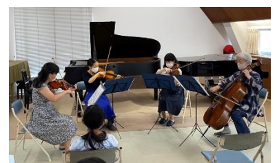
最終日は皆さんのご家族をお招きして発表会を行いました。