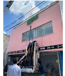
見守っていたスタッフも思わず手に汗握る搬出作業でした…。