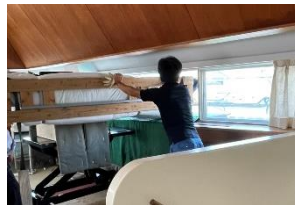
いざ搬出開始! 搬出口となった窓の高さはわずか64cmほど…こんなに狭いところから出せるのでしょうか(汗)!!!