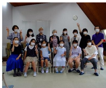
合宿最終日の集合写真。発表会も終わり、すっかりリラックスした様子です(笑) 来年もたくさんのご参加をお待ちしております♪