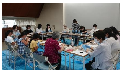
2日目の午後は、お楽しみ企画「和菓子体験教室」。先生も生徒も一緒になってわいわい楽しみました。