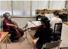
普段の個人レッスンとは違い、他の楽器の音を聴いて呼吸を合わせる練習は難しくも楽しく、あっという間に時間が過ぎていきます。