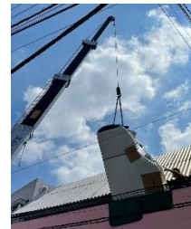
窓から出ました! クレーンで慎重に下ろしていきます。