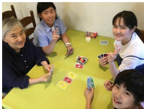
← 花火をしたりゲームをしたり・・・レッスン以外のお楽しみもたくさん! ゆったりと濃密な時間を共にする中で、年齢も立場も越えて自然と関係性が深まります。