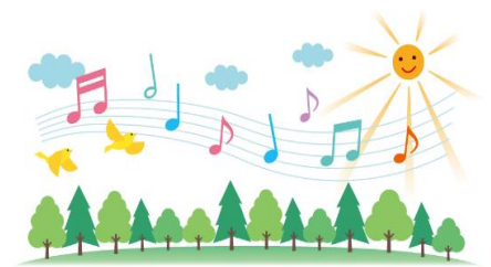
← 参加メンバーで最終日の発表会に向けて手作りしたプログラム。