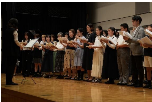
↑演奏会の最後は、中学生以上の生徒さんと大人の方でエルガーの合唱を披露しました。

若者たちのための室内楽クラスも、お客様の前で演奏する機会を重ね、音楽的成長が感じられます。↓