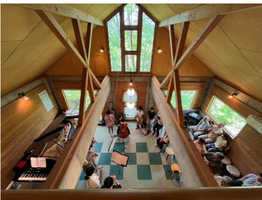
↑ 解放感たっぷりの吹き抜けの“ペンションドルチェ”で、気持ちの良い4日間を過ごしました。