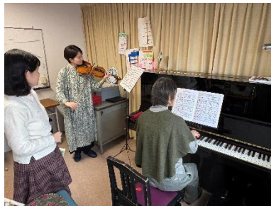
↑先生の指導を受け、お互いの音を聴き合っってアンサンブルを作り上げる経験は、どなたにとってもきっと楽しい学びになることと思います。

ソルフェージュスクールでは年に2回、アンサンブルのイベントがあります。秋の「楽しくアンサンブル」と春の「ミュージックキャンプ」。おひとり参加も、お友達のご参加もどちらも大歓迎です！気になる方はぜひお気軽にお問い合わせください！